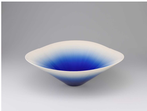
たじま しょうに 田島 正仁「彩釉鉢」 準大賞・日本陶芸展賞