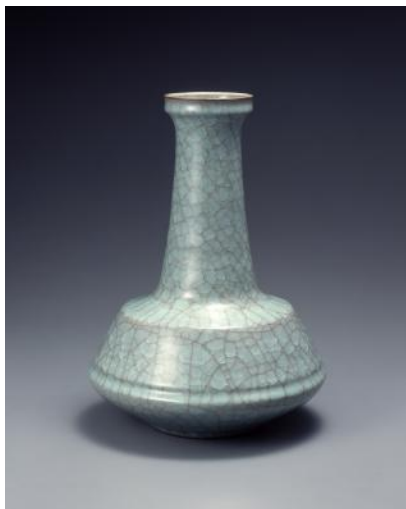
青磁 岡部嶺男 ふん せいじ おおきぬた 粉青瓷大砵 1969年 当館蔵