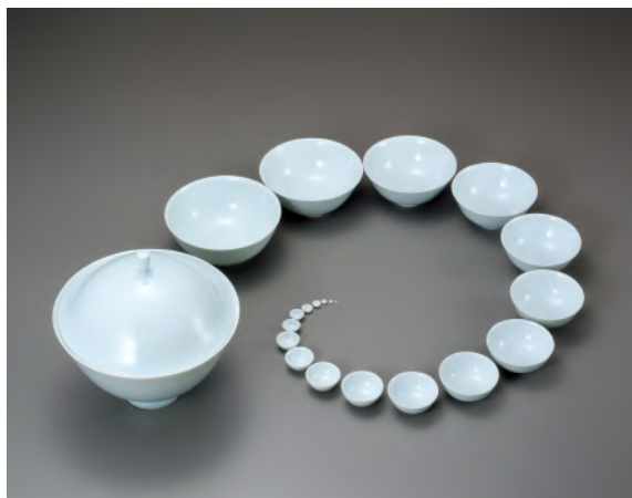
青白磁 八木明 青白磁入れ子鉢 2003年 当館蔵