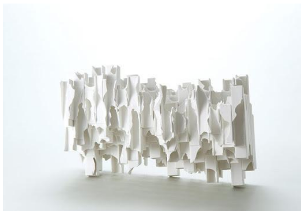
白磁 竹内紘三 Modern Remains Avalanche 2014年 現代美術 艸居蔵