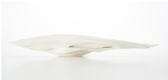
白磁 松村淳 (un)dynamic equilibrium 2019年 個人蔵