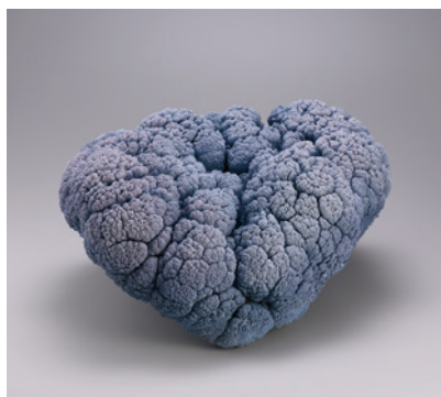
アイザワリエ 鱗 優秀作品賞・文部科学大臣賞