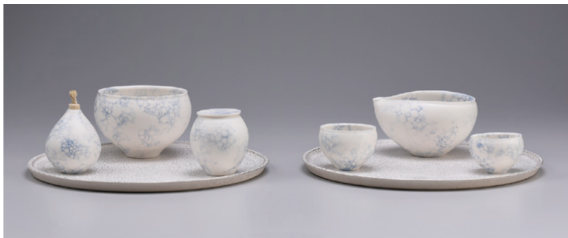
高橋朋子 minamo 水澄む朝 宵ざりの水 特別賞・茨城県陶芸美術館賞