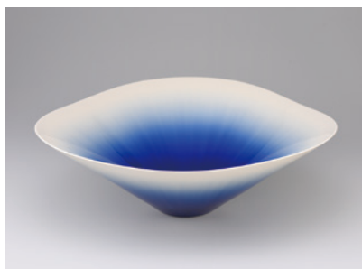
田島正仁 彩釉鉢 準大賞・日本陶芸展賞