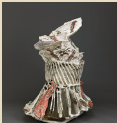
第24回大賞・桂宮賜杯 井上雅之 NT-171

割引券 この券をお持ちいただく1枚に 引き換えに、本展覧会を 引換券(団体料金と同 額)にてご利用 いただけます。