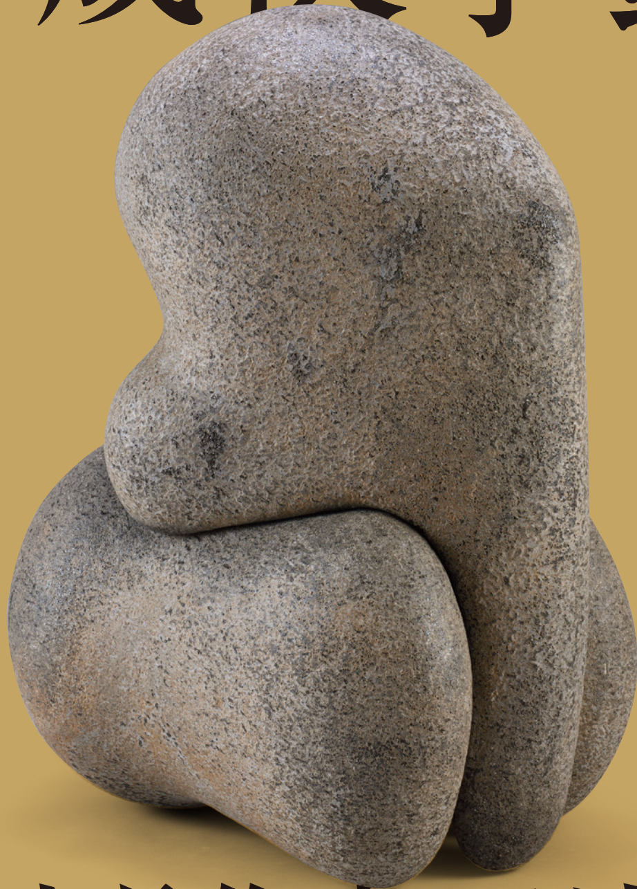
大賞・桂宮賜杯「五味謙二」[Shinobu no Sake]