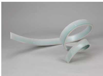
木野智史 嵐「廻」 特別賞・U35賞