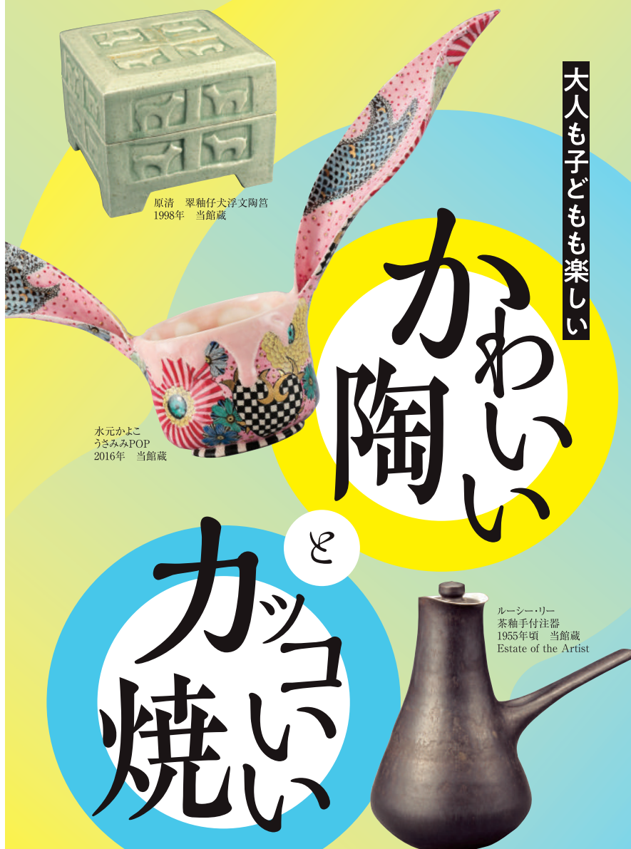
原清 翠袖仔犬浮文陶器 1998年 当館蔵