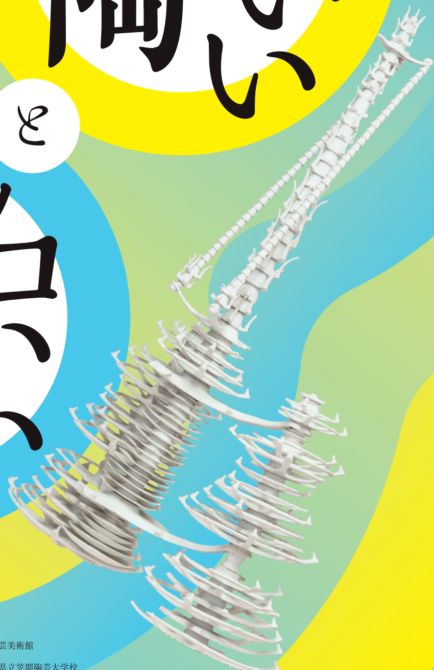
左 | 滋賀県立信楽窯業試験場・八木一夫デザイン 賞 1961年 当館蔵 右 | 中田博士 cera debris 2006年 当館蔵