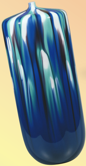
三代 徳田八十吉 耀三彩壺 2003年 当館蔵