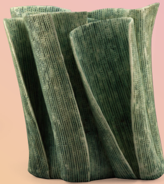
神田樹里 志向 2014年 当館寄託