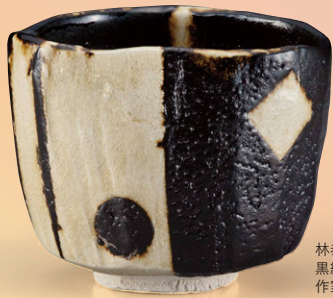
林恭助 黒織部茶碗 2015年 作家蔵