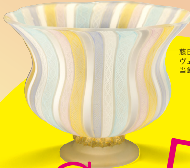
藤田喬平 ヴェニス花瓶 2000年頃 当館蔵