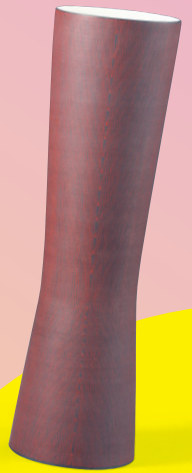
中田雅巳 SEN 2014年 当館蔵