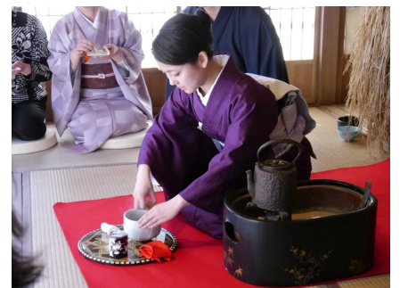
椅子席で気軽にお茶を楽しめます。

■定員 各席とも先着10名。事前予約も可能です。詳細はお電話等でお問い合わせください。