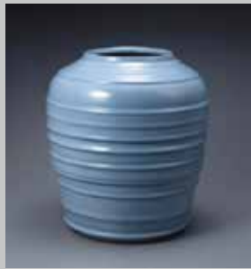
中島宏 青瓷彫文壺 1995年