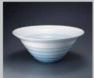
井上康徳 白磁青釉線刻文花器 2013年