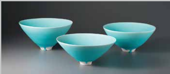
富川秋子 水青釉鉢-氷解く- 2012年