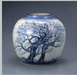
近藤悠三 寒木染付花瓶 1946年頃