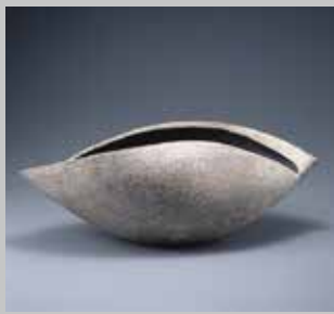
飯沼耕市 銀泡彩鉢「KURUMU」 2010年