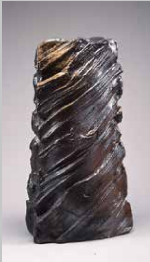
伊勢崎淳 風雪 2011年