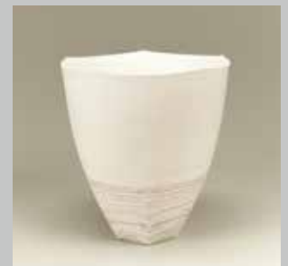
星野友幸 練継花器 2013年