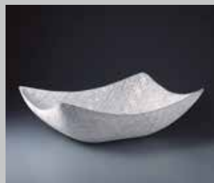
山路和夫 剪紙繋型小紋四方器 2011年