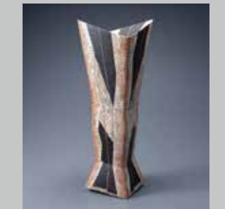
澤田勇人 赫彩器 2012年