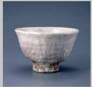
玉村登陽 萩粉引茶碗 2012年