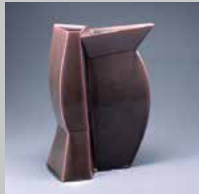
高垣篤 茜青瓷-曙 2012年