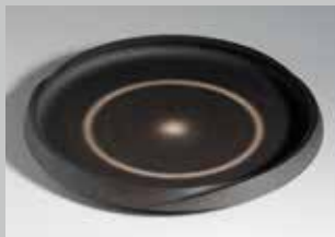
浜岡満明 光輪文黒器 2012年