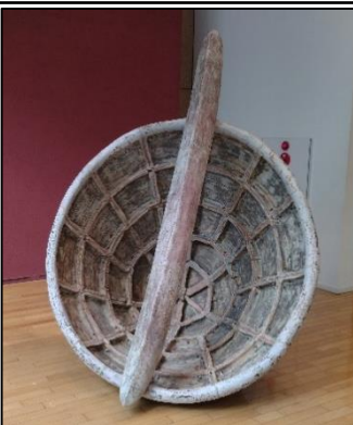
作家名：井上雅之 作品名：K-954