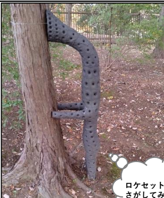
作家名：浅野暢晴 作品名：人を喰ったような