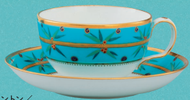
ミントン/ クリストファー・ドレッサー(デザイン) 植物文トリオのうち一客 1871年