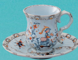
エミール・ガレ 人物文コーヒーセットのうち一客 1880-1884年