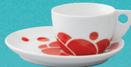
ユッタ・ジカ カップ&ソーサー 1901-1902年