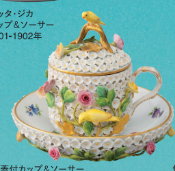
マイセン 貼花鳥飾蓋付カップ&ソーサー 19世紀後期