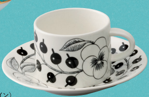
アラビア/ ビルゲル・カイピアネン(デザイン) 三色スマイルと果実文食器揃「バラティッシ」のうち一客 1972-1974年