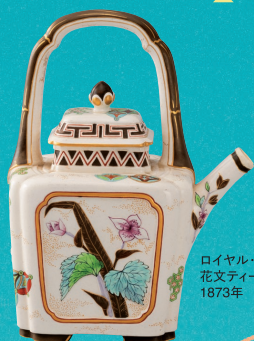
ロイヤル・ウースター 花文ティーポット 1873年