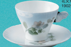
ロイヤル・コペンハーゲン 花文カップ&ソーサー 1902-1922年