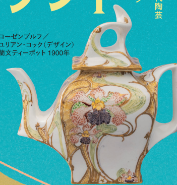
ローゼンブルフ/ ユリアン・コック(デザイン) 蘭文ティーポット 1900年