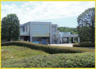
茨城県陶芸美術館