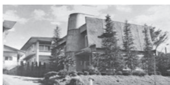
当時の茨城県窯業指導所(笠間市下市毛) (『茨城の窯業史』p.40掲載)

昭和の中頃になると、太平洋戦争などで笠間の窯元はわずか8軒まで減ってしまいます。その上、やきものに代わりプラスチック製品が使われるようになり、笠間焼の品物が売れなくなります。笠間焼がなくなること心配した人たちが、時代に合った笠間焼づくりを進めるため、茨城県窯業指導所をつくりました。さらに陶芸団地、笠間芸術の村、窯業団地をつくり、県外から作家を呼びよせたことで笠間は作家の街になりました。