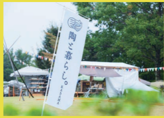
陶器市「陶と暮らし。」の様子