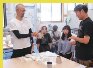
茨城県立笠間陶芸高等学校での授業の様子