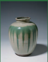
白釉青流掛茶壺 明治～大正時代