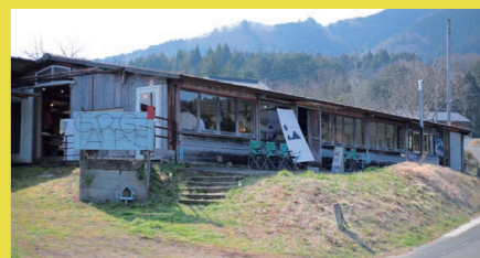
GARAGE(ガラージ) 2007年に作家たちが笠間市内の古い建物を利用して作った、月に1、2回作品展示やワークショップを行う場所。