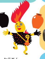
ケラモン 茨城県陶芸美術館 教育普及キャラクター

いまの笠間や、周りの地域では、いろいろな土を使って、いろいろな色や形のやきものがつくられている。笠間焼にはどうしてこんなに種類があるのかな。くわしく見てみよう!