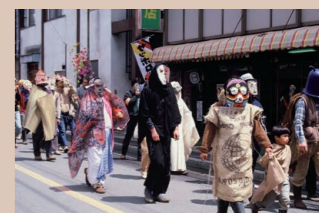
第一回陶炎祭、仮面を付けた行列の様子 昭和57年(1982)