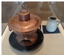
△料理に関する展示 (2階第2会場)