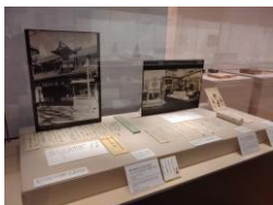
△たくみ工芸店に関する展示 (地下1階第1会場)