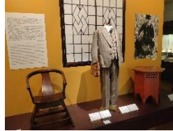
△家具やスーツなどの展示 (地下1階第1会場)