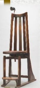
吉田璋也デザイン 患者用診察椅子 1952年 個人蔵