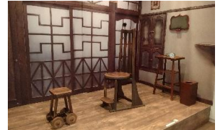
△吉田医院を再現した展示 (2階第2会場)