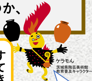
ケラモン 茨城県陶芸美術館 教育普及キャラクター

新作民藝とは よしだ 吉田さんが地元の しよくにん 職人さんたちと きょうりよく 協力してつくった にちようひん 日用品のことだよ。