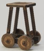
吉田璋也デザイン 患者用診察椅子 1952年 個人蔵